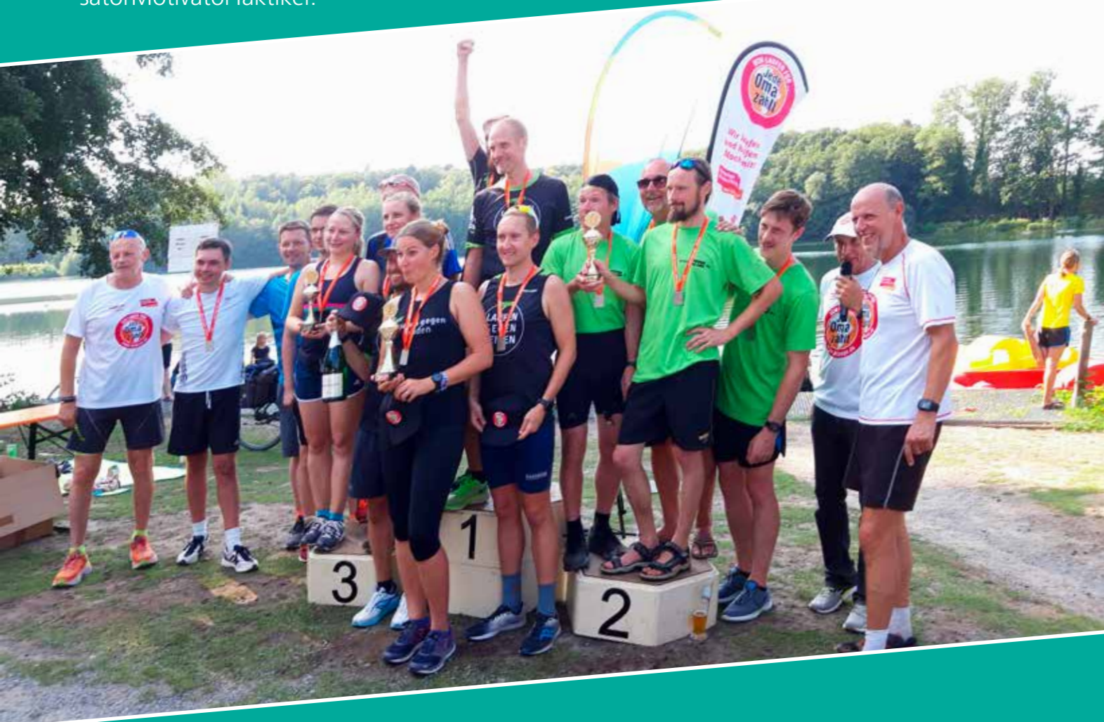
Lega S ... läuft ... auf den 2. Platz der Staffeln.